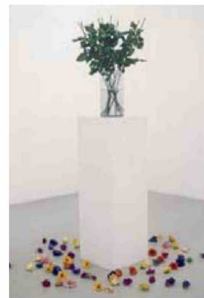
Les flors caigudes s'acumulen en l'obra d'Otto Berchem.

L'anglès Matthew Darbyshire ha creat un punt d'informació sui generis que apunta als mitjans de comunicació. Ha fet uns cartells que barregen els eslògans dels cartells contra la sida dels anys vuitanta amb imatges d'anuncis de paper higiènic (el del gosset) per desmuntar els discursos que s'han creat a l'entorn de la sida des d'aleshores. —